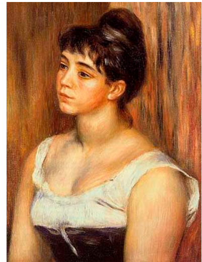
Pierre Auguste Renoir: Suzanne Valadon (1885)

G. Mahler (1856-1911) G. Puccini (1858-1924) Carl Nielsen (1865-1931) A. Scriabin (1872-1915) M. de Falla (1876- 1946) S. Rachmàninov (1873-1943) Í. Stravinski (1882-1971)